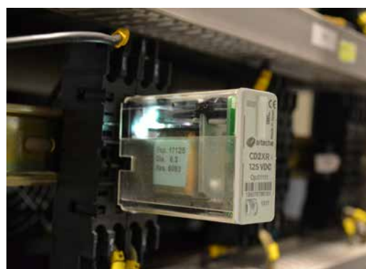
› Relé para cargas especialmente pesadas durante un test de endurencia mecánica