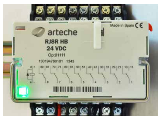
› Relé con reset eléctrico en funcionamiento