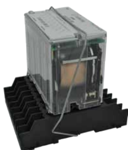
› Enclavamientos E**

Las bases delanteras y traseras pueden incorporar enclavamientos. E0 es compatible con todos los relés de Artech. Disponemos de enclavamientos metálicos que se ajustan a las dimensiones de cada relé.