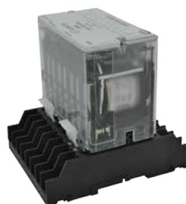
› Enclavamientos E0