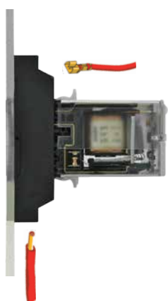
› Base toma delantera