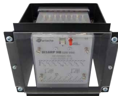
› BI16RP HB 125 VDC (Base I-EMP)