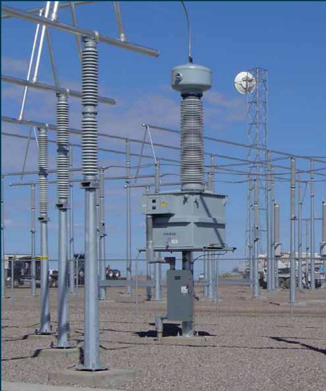
› Trasformatore per servizi propri della sottostazione modello UTP da 245 kV. Coyote Switch (Stati Uniti).