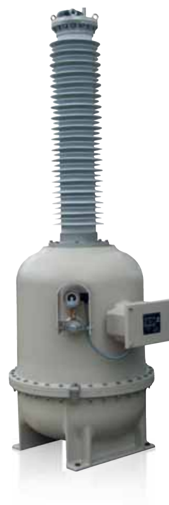
> Modello UG