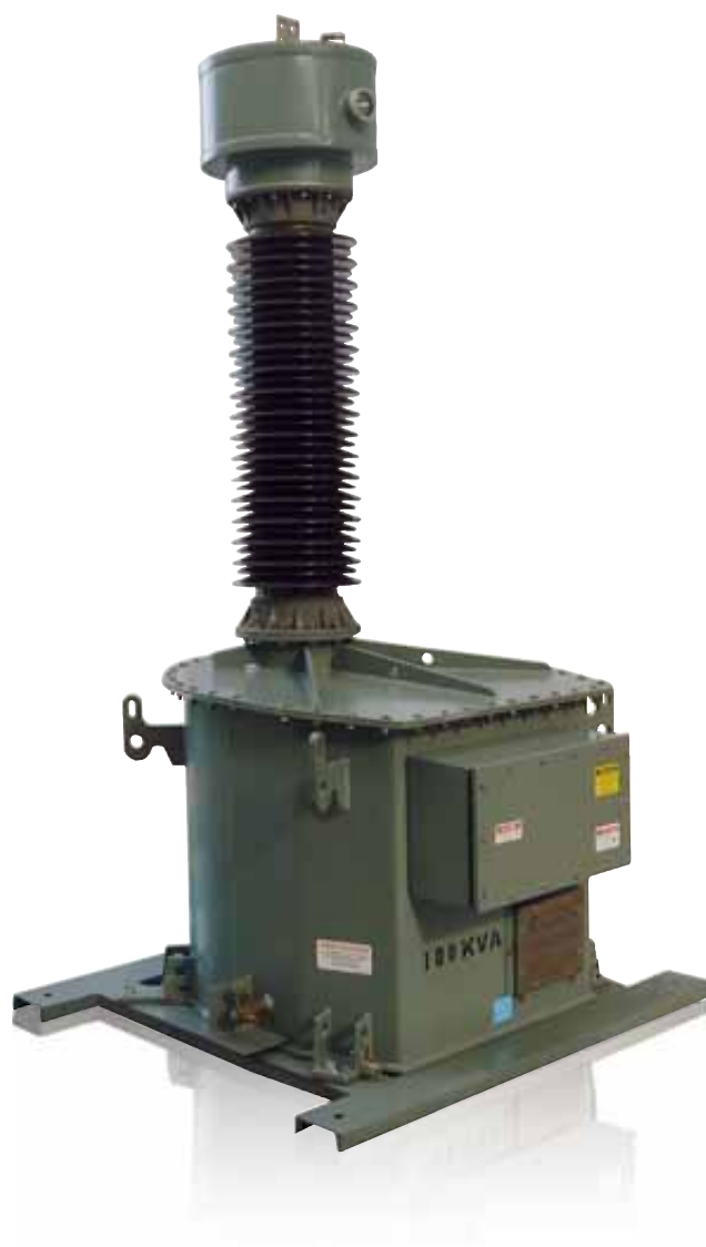
> Modello UTP

Isolamento a gas: modello UG fino a 550 kV e 100 kVA.