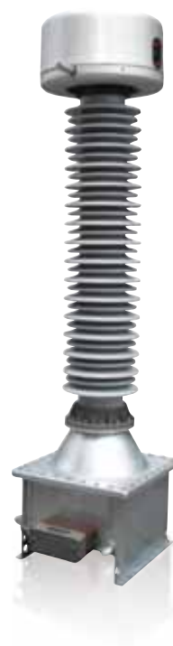
> Modello UT