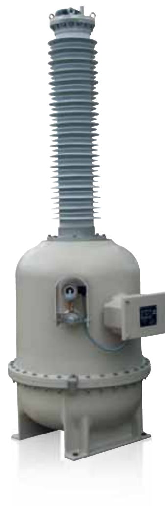
> Modelo UG