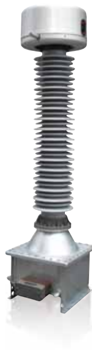
> Modelo UT