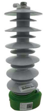
› Undercap: coupleur PLC pour lignes intérieure/souterraine jusqu'à 36 kV