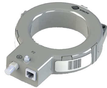
› ICNH-1 capteurs de courant