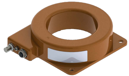
› ICNH-2 capteurs de courant