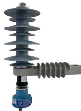
› Overcap: coupleur PLC pour lignes aériennes jusqu'à 36 kV