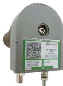
› PlugCap: PLC pour compartiments de MT GIS

Notre éventail de coupleurs offre le meilleur rendement disponible en communications. Le design d'Arteche permet une installation rapide et aisée et la sécurité du personnel qui manipule les coupleurs lors des installations, ainsi que la sécurité du réseau électrique.