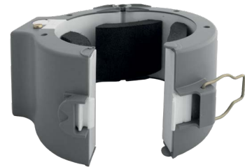
› Capteur divisé Rogowski